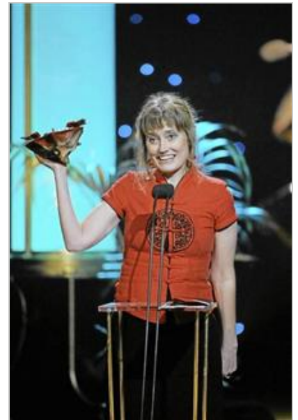
2008 Vinner guldbagge för "Nunnan".

Bland mycket annat avslöjade Daina för Maud Nycander varför hon hade lämnat sina två barn för att kunna flytta ihop med en ny man sedan hon blivit änka. I filmen döljer inte de två nu vuxna barnen inför Maud Nycanders frågor vad de känner inför